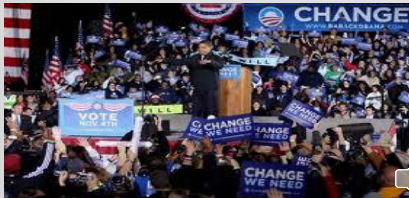
الولايات المتحدة الأمريكية